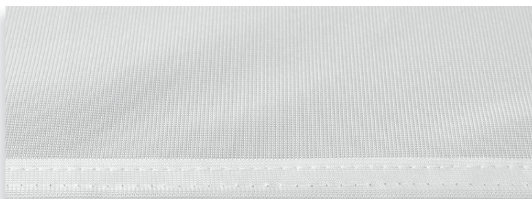
Fahnenstoff mit Saum